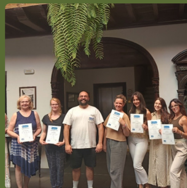
Puerto de la Cruz